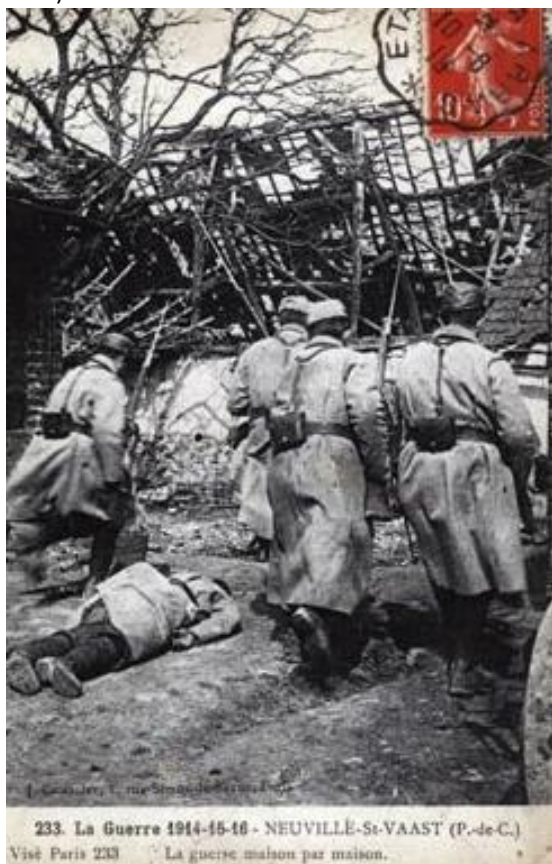
233. La Guerre 1914-16-16 - NEUVILLE-St-VAAST (P.-de-C.) Visé Paris 233 La guerre maison par maison.

Afin de bénéficier d'une surprise et de donner à l'opération son maximum de portée, cette offensive doit coïncider avec une attaque secondaire, entreprise dans la région d'Arras (l'offensive en Artois) par les forces combinées du général Foch et du maréchal britannique John French (1858-1925).