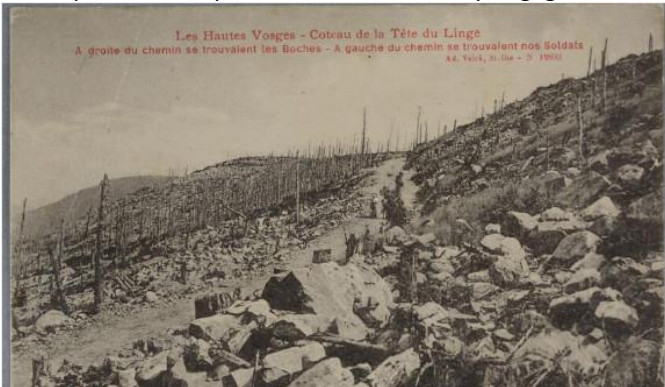
Coteau de la Tête du Linge (Lingekopf). Les arbres ont été détruits par l'artillerie.

Le haut état-major français envisage une série d'opérations offensives ayant pour but de s'emparer de la haute vallée de la Fecht et de Munster. Mais, entre la conception de cette stratégie et le début de son exécution, de nombreuses modifications interviennent, eu égard à l'étendue du front d'attaque et de l'importance des effectifs à y engager.