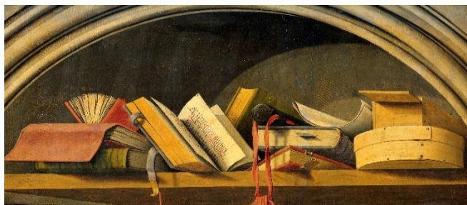
Barthélemy d'Eyck (1444-1469), Triptyque de l'annonciation, détail, Rijksmuseum, Amsterdam.

Toute l'équipe de la bibliothèque de Notre-Dame de l'Isle vous souhaite une bonne et heureuse année 2017, ponctuée d'agréables moments de lecture et de découvertes littéraires.